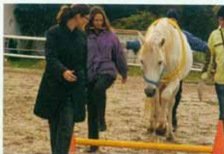
... dann ohne, über Hindernisse (auch metaphorisch gebraucht) und mit definierten Aufgaben (z. B. Ringe über den Hals streifen) von A nach B zu lotsen. Auch jeder Zweibeiner bekommt dabei eine Aufgabe, ...