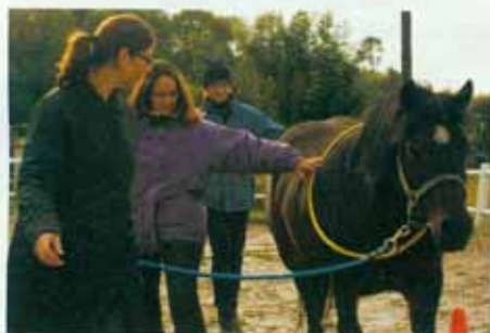
Vom „Business-Casual“ in wetterfestes Freizeitgewand, dann kann's losgehen. Die Aufgabe: Im Team unter der Leitung einer Teilnehmerin auf Führungsposition 1 (Lady in Black) ein Pferd mit Strick, ...

Wie leite ich mein Team? Aus Position eins, zwei oder drei? Wie komme ich an? Welche Emotionen löse ich bei anderen aus? Was kann ich gut, was weniger? Das alles und noch viel mehr sollten einem die vierbeinigen Therapeuten beim pferdeunterstützten Führungstraining im Idealfall durch ihr Verhalten zeigen.