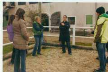
... am Schluss wird analysiert, wie es jedem in seiner Position als „Anführer“, „Anschieber“ oder „Begrenzer“ ergangen ist, wie man miteinander harmonierte – eine Art Familienaufstellung mithilfe des Haustiers

Es beginnt mit einem missglückten Experiment: Wir sollen die Pferde beim Umgang miteinander beobachten und dann ausloten, welches der drei das Ranghöchste ist. Alle tippten richtig auf den weißen Neo, wo doch gewöhnlich immer Osho, der größte